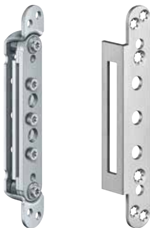
Bsp. Aufnahmeelement VX 7531 3D Bsp. Abdeckwinkel VX 7561 KK

i Der o.g. Belastungswert bezieht sich auf zwei Bänder pro Flügel (1x2 m).